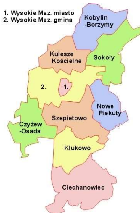
Rysunek 2 Gmina Kulesze Kościelne na tle powiatu wysokomazowieckiego