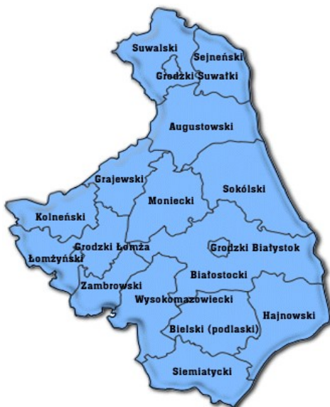
Rysunek 1 Lokalizacja miejscowości na tle województwa podlaskiego

Siedzibą organów Gminy jest miejscowość Kulesze Kościelne.