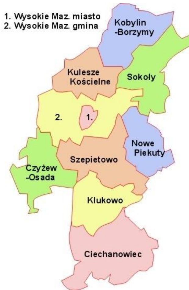
Rysunek 1. Gmina Kulesze Kościelne w powiecie wysokomazowieckim